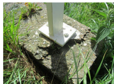
Betonblokken - beschadigd en niet passend