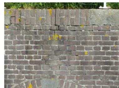
Keermuren - los metsel- en voegwerk