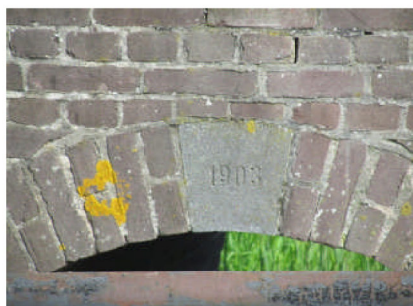
Sluitsteen met jaartal "1903"