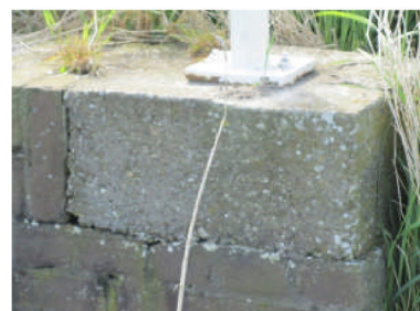
Betonblokken - beschadigd en niet passend