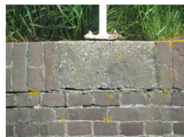
Keermuren - los metsel- en voegwerk